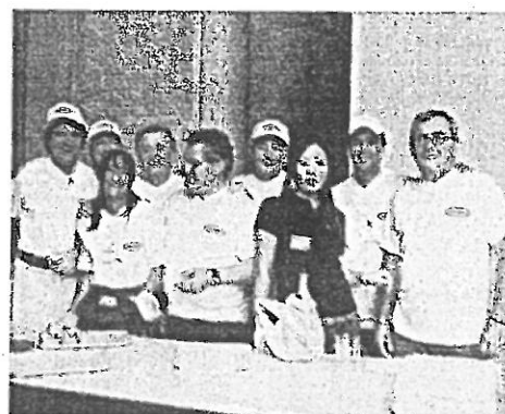
Foto di gruppo per lo staff di cucina