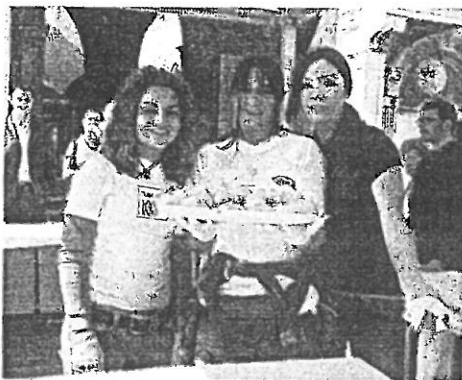
Tre belle standiste con i panini appena preparati