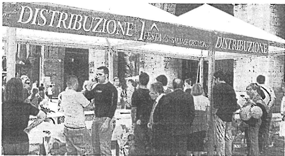
In coda al banchetto per assaggiare un panino col Salame Cremona